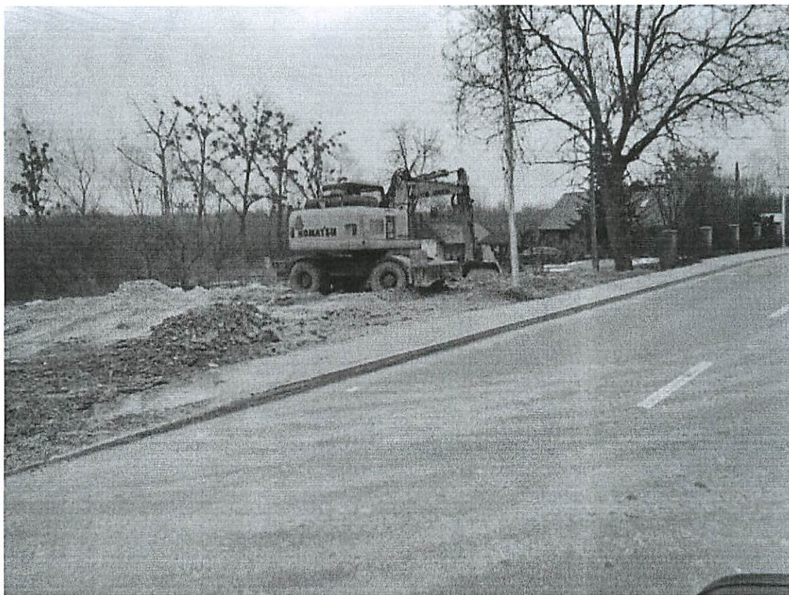
Teren składowania odpadów w rejonie działki nr 28 przy ulicy Puławskiej w Kazimierzu Dolnym.