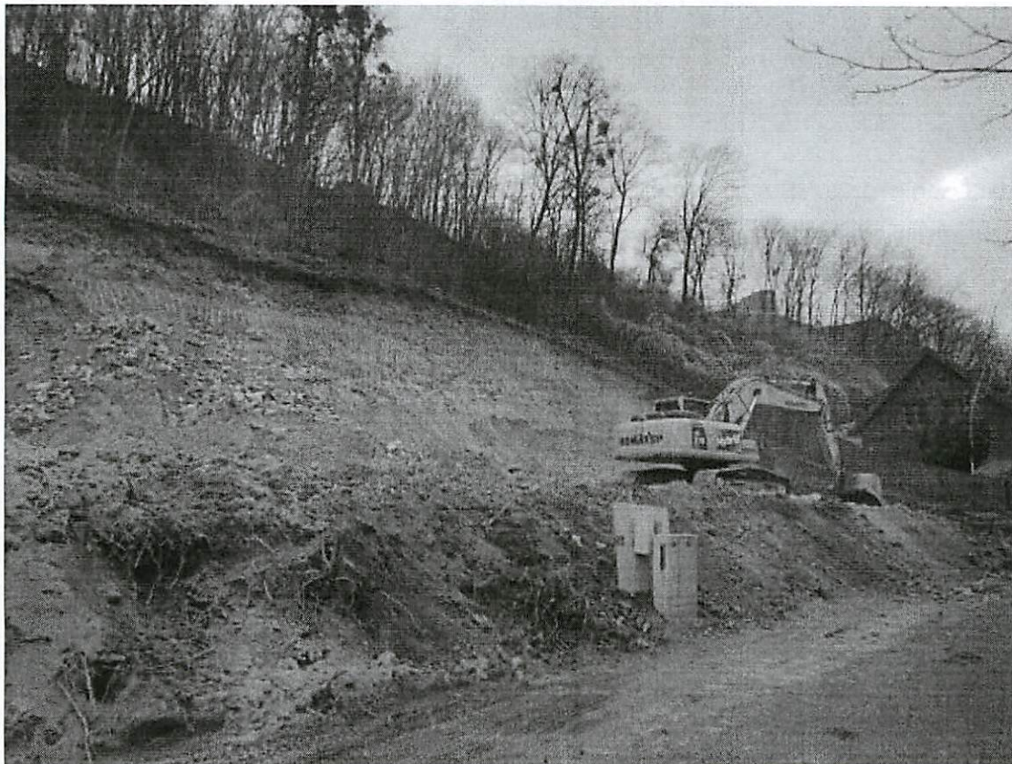
Teren budowy przy ulicy Puławskiej 28/30, działka nr.715/5

Proszę również zwrócić uwagę podległym Panu służbom na tonaż taboru samochodowego pracującego na wskazanej budowie, pod kontem ewentualnego niszczenia jezdni. Załączam zdjęcia dokumentacyjne: